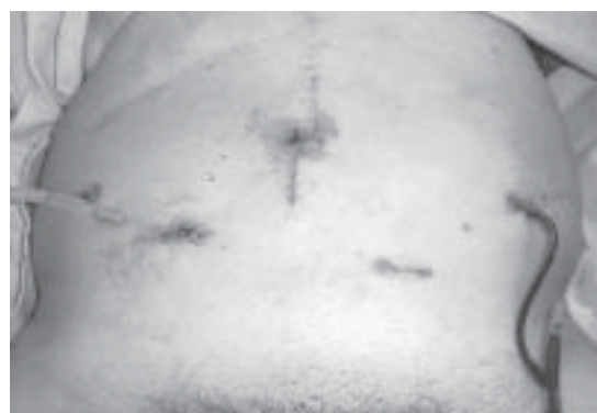
Figura 3. Fotografía de paciente al término de una cistectomía radical laparoscópica con confección extracorpórea de neovejiga ileal ortotópica.

La técnica fue reproducida en todos los pacientes. El tiempo operatorio promedio fue 328 minutos (5.4 horas) con un rango de 270 a 420 minutos. En la Tabla 1 se desglosan los tiempos quirúrgicos de cada paciente. Hubo 2 complicaciones intraoperatorias: una lesión de arteria ilíaca que fue reparada laparoscópicamente con sutura intracorpórea y una lesión de vasos epigástricos, también controlada intraoperatoriamente. El sangrado promedio fue 410 ml (rango: 200-800 ml). Ninguno de los pacientes requirió transfusión sanguínea. El tiempo de hospitalización total varió entre 5 y 12 días, con un promedio de 6,8 días.