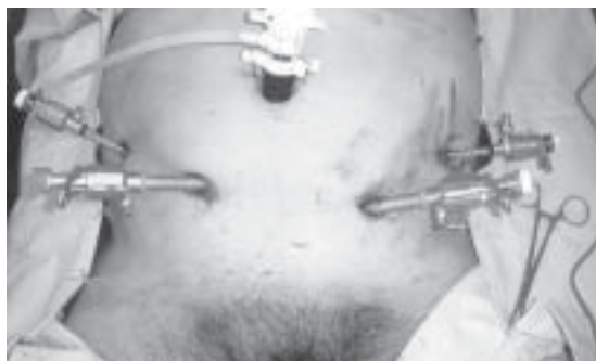
Figura 1. Ubicación de trócares en un paciente llevado a cistectomía radical laparoscópica con confección extracorpórea de neovejiga ileal ortotópica.

su extremo distal para lograr una dilatación hidrostática.